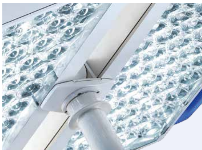
A matriz multi-lente otimiza a iluminação

O sistema de iluminação óptica com uma matriz multi-lente altamente sofisticada proporciona excelente distribuição da luz emitida, e garante qualidade de luz homogênea para procedimentos superficiais e profundos em cavidades. A disposição dos elementos de LED e a orientação deles dentro do foco cirúrgico elimina a necessidade de reajuste durante procedimentos cirúrgicos.