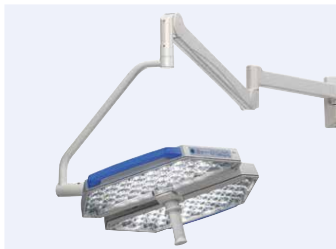
Versão fixada na parede do foco cirúrgico TruLight™ 3000

Como um foco cirúrgico eficiente, o TruLight™ 3000 preenche a lacuna entre emissão de luz sem interrupções e custo-benefício, o que fornece um valor agregado evidente em relação às tecnologias de iluminação mais antigas, como lâmpadas halógenas ou HID (gas discharge/high-intensity discharge, descarga de gás/descarga de alta intensidade). A eficiência de energia e a durabilidade dos focos cirúrgicos em LED também tornam o foco cirúrgico TruLight™ 3000 ecologicamente correto.